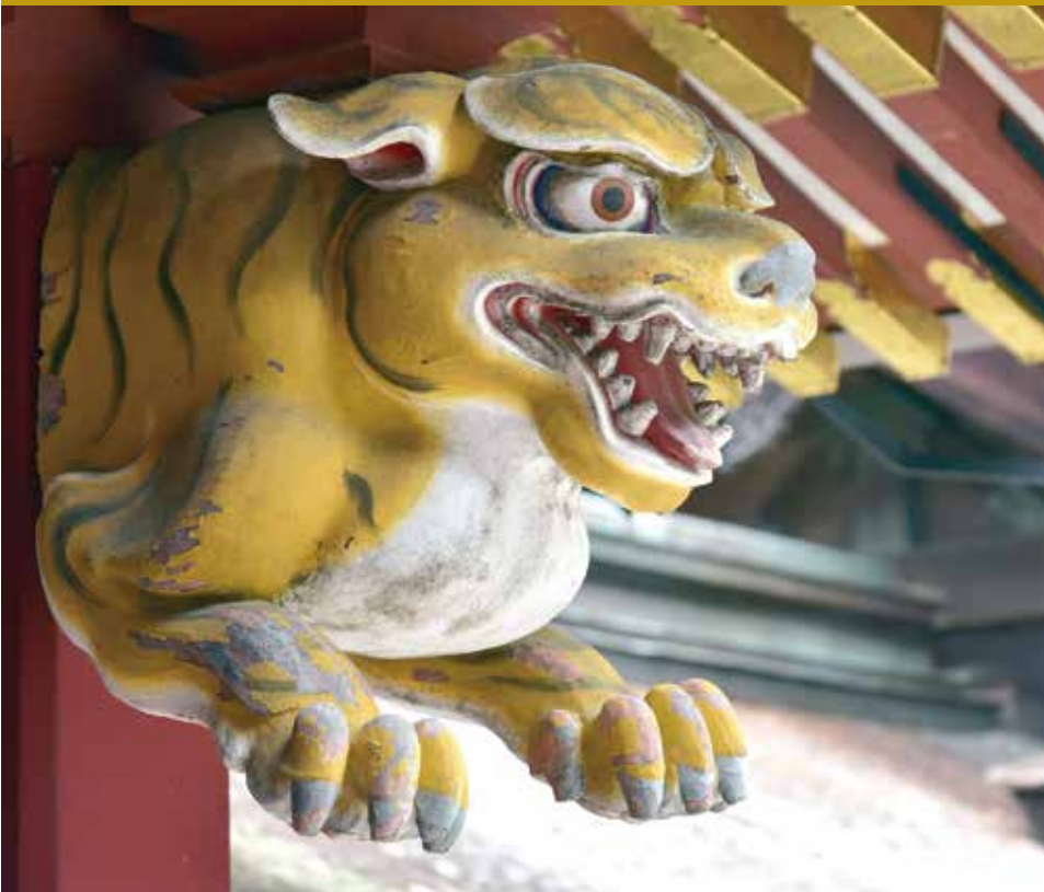
鹽竈神社左右宮拝殿の木鼻彫刻