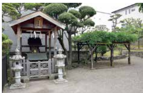
牛石藤鞭社と藤棚

伝承によれば、鹽土老翁神様が子供の姿となって牛の背に塩を積んで運びに上がったが、この時に鞭がわりに用いた藤の枝が社のそばに根付き、また疲れた牛が石と化して牛石となつたと伝えられています。通常は水中に没して目にする事ができない牛石ですが、