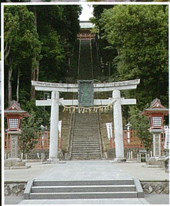
表参道鳥居与石段 / 表参道鳥居、石段