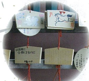
絵馬 书写上自己的愿望并祈祷 書寫上自己的願望並祈禱