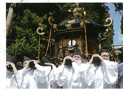
帆手祭 3月10日 表坂神輿渡御