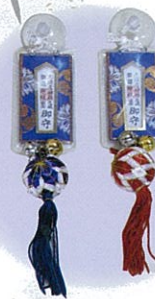
交通安全御守 交通安全