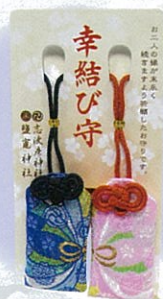
縁满好孕御守 夫婦恋人円満子宝