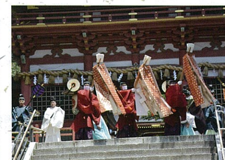
鹽釜神社例祭 7月10日 御出幣式