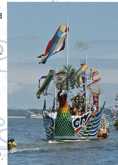
鹽竈港祭 7月第3星期一 御座船