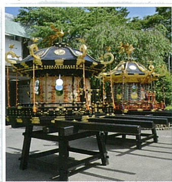
志波彦神社与鹽釜神社的神輿 志波彦神社、鹽釜神社的神輿