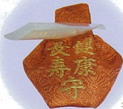
健康长寿御守 健康長寿御守