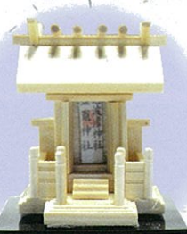
御守神殿 职场·车中安全 職場·車中安全