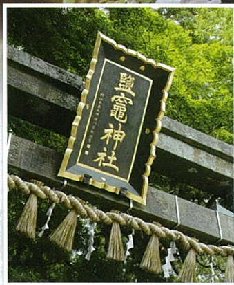
東参道の鳥居与扁額 東参道與鳥居的扁額