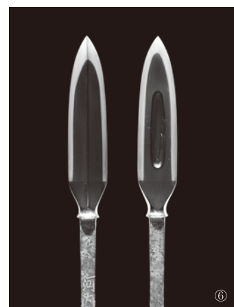
【掲載写真】①太刀 銘 来国光（重要文化財）／②直槍 銘 来国秀 ③鍔形槍 銘 武藏太郎安国／④片鎌槍 銘 国久／⑤牛角手違十字槍 無銘／⑥笹穂槍 無銘／表写真：上鎌十字槍 銘 兼常